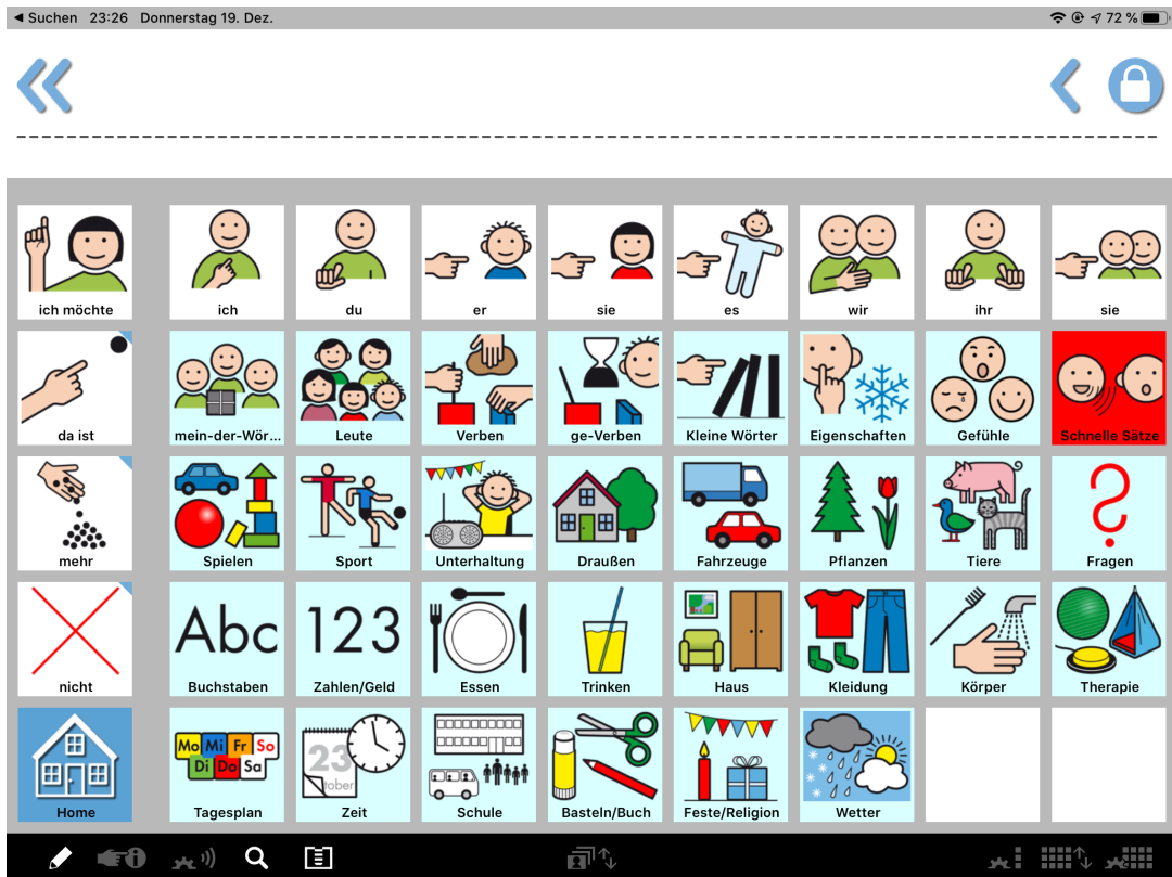
Vollständig angezeigtes MetaTalkDE Vokabular